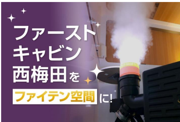
【住空間コーティング】 「美と健康」のホテル ファーストキャビン西梅田