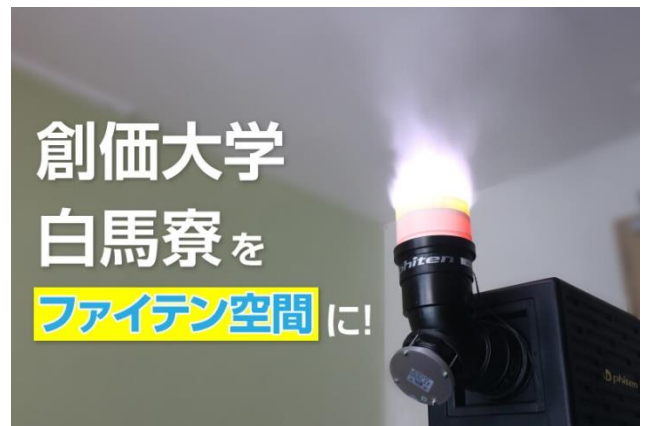
【住空間コーティング】 東京 八王子 新「創価大学 白馬寮」駅伝部寮