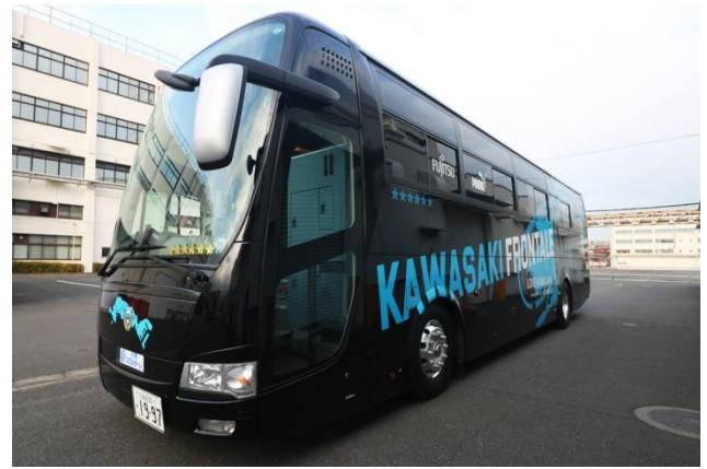
【車内コーティング】 川崎フロンターレ オフィシャルチームバス