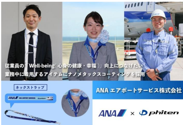
【アイテムコーティング】 【ANA × phiten】 業務中に着用するアイテム