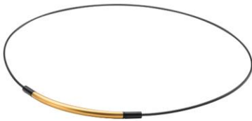
ゴールド/ブラック

軽量のワイヤー素材は、水に強く、 スポーツシーンのハードな使用にも 耐える高耐久素材。