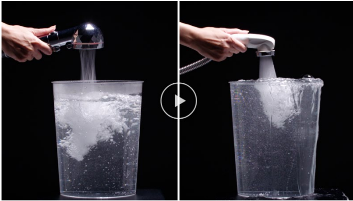
旧シャワーヘッドとの節水比較映像

手元にはワンタッチで水を止められる一時止水ボタンを配置し、水の出っぱなしを防ぎます。