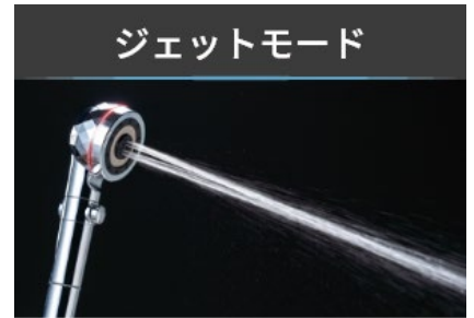
頭皮、身体のマッサージ、 歯や爪などの隙間洗浄におすすめ