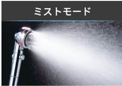
メイク落とし、洗顔、毛穴ケアにおすすめ