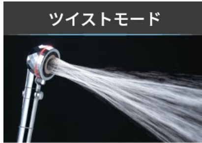
体や髪の洗い流しにおすすめ