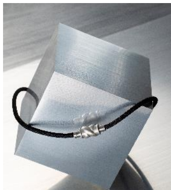
名称 : アペロン サイズ : 全長50cm 価格 : ¥60,500 (税込) 技術 : アクアチタンX100

カジュアル・フォーマルどちらも合わせやすいシンプルなデザインで、ビジネスシーンでも違和感なくお使いいただけます。