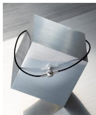
名称 : スパイラ サイズ : 全長45cm 価格 : ¥60,500 (税込) 技術 : メタックス