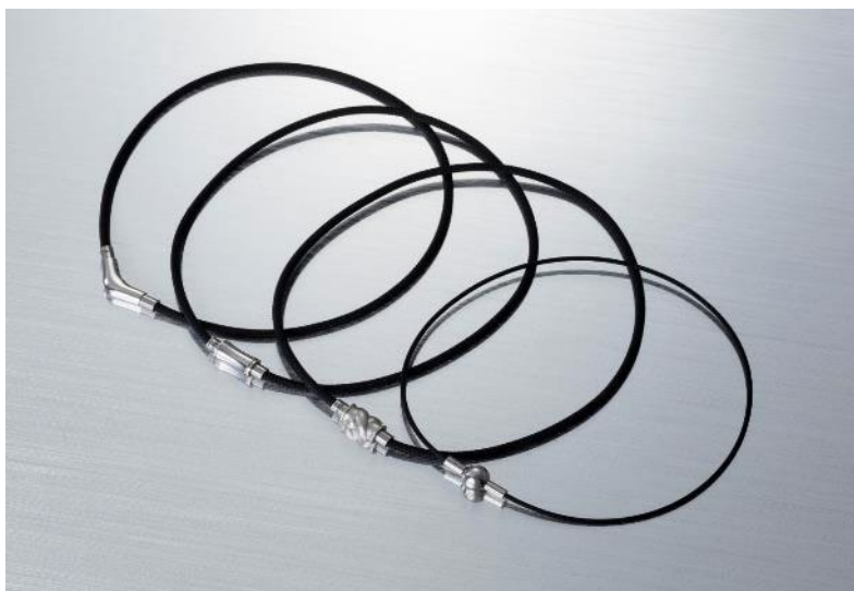
ファイテンコラボ商品 ネックレスタイプ

Soul Jewelry オンラインストア： https://www.mao-online.com/