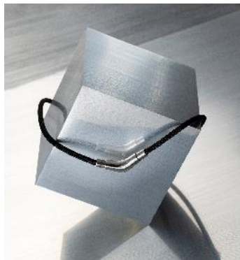
名称 : アルク サイズ : 全長50cm 価格 : ¥60,500 (税込) 技術 : アクアチタンX100